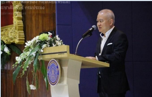
5 มิถุนายน 2562 TTIA เข้าร่วมงานแถลงการณ์ International day for the Fight Against Illegal, Unreported and Unregulated Fishing (IUU Day) อ่านต่อหน้า 2