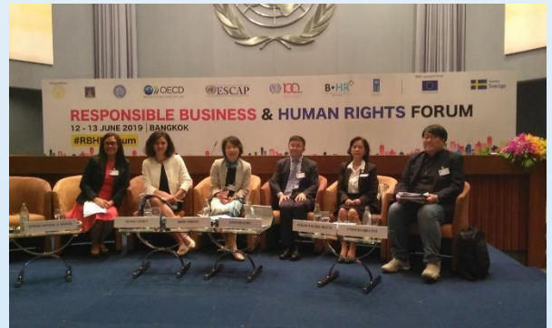
12 มิถุนายน 2562 TTIA ได้เข้าร่วมการประชุมระหว่างประเทศ และร่วมเป็น speaker ในงาน "การดำเนินธุรกิจที่มีความรับผิดชอบต่อและเคารพสิทธิมนุษยชน (Responsible Business and Rights Forum)" อ่านต่อหน้า 9