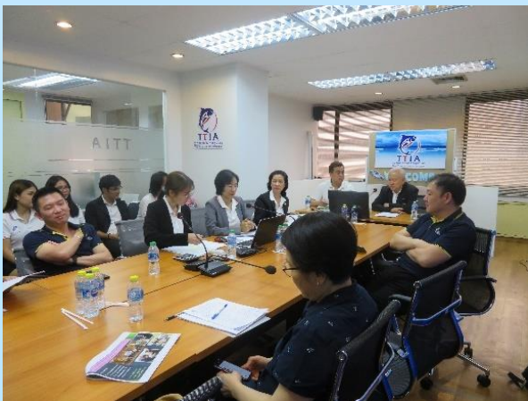
13 มิถุนายน 2562 สมาคมฯ จัดประชุมวิสามัญ TTIA ครั้งที่ 3/2562 ณ สำนักงาน TTIA อ่านต่อหน้า 10