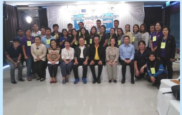
17-18 มิถุนายน 2562 TTIA ร่วมเป็นวิทยากรในงานอบรมแนวปฏิบัติการใช้แรงงานที่ดี GLP รอบอบรมสมาชิกโรงงานทางใต้ อ่านต่อหน้า 12