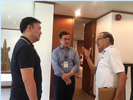
6 มิถุนายน 2562 TTIA เข้าร่วมประชุม Tuna Sub Group ภายใต้ Sea Food Taskforce(STF) อ่านต่อหน้า 4