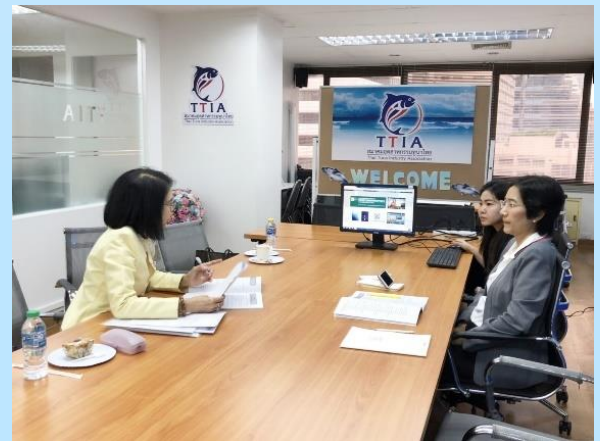
19 มิถุนายน 2562 TTIA ให้สัมภาษณ์กับผู้ตรวจประเมินสมาคมฯ จากม.หอการค้าไทย ในโครงการประกวดสมาคมการค้าดีเด่น ประจำปี 2562 อ่านต่อหน้า 13